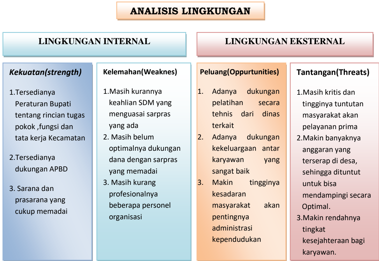
Diagram analisis SWOT dengan analisis lingkungan strategis

Maka dari Analisa kekuatan, kelemahan, peluang dan hambatan yang dihadapi oleh Kecamatan Driyorejo Kabupaten Gresik adalah sebagai berikut :